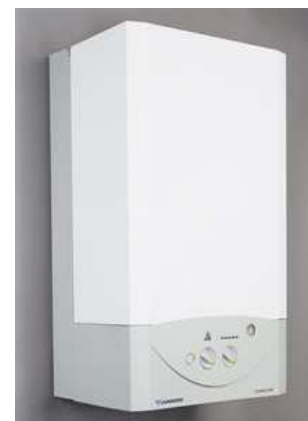
Gazowy przepływowy ogrzewacz wody